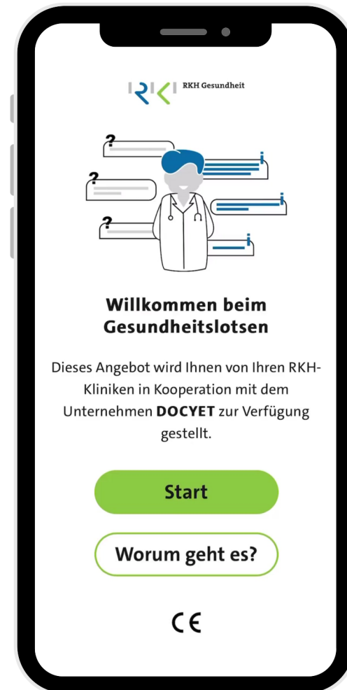
Beispiel 2: Triage + Zuweisung Versorgungsebene im KH