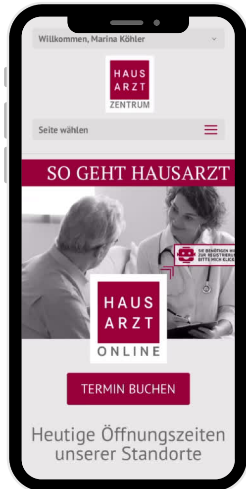
Beispiel 1: Anamnese + Priorisierung in der Praxis